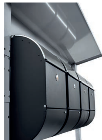
ALLUX 3000 rustfri sort.