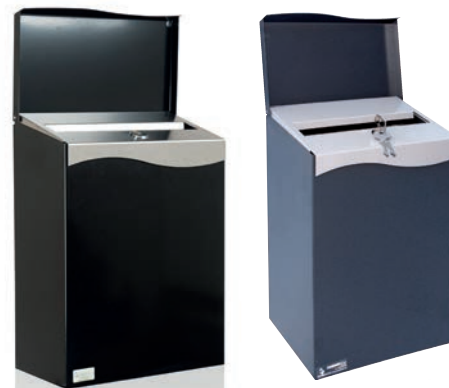
Villa Formfin Sort RAL 9005 med underlokk i børstet rustfritt stål.