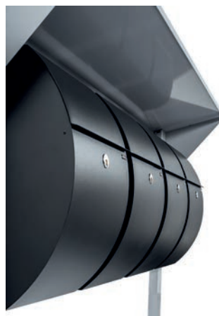
ALLUX 7000 sort.