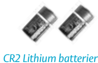
CR2 Lithium batterier